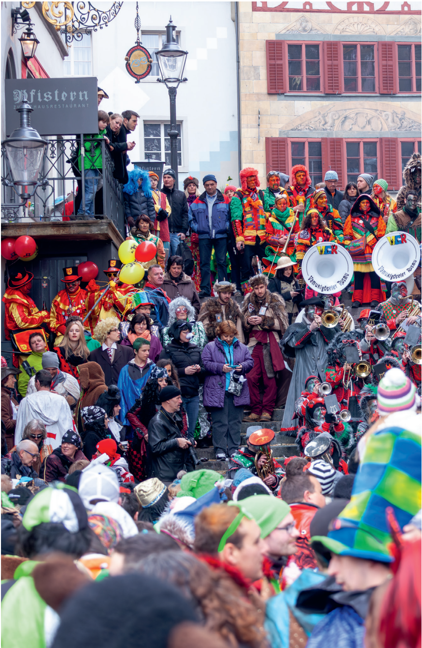
«Rüüdig gueti Stemmig» auf der Rathausstuppe.