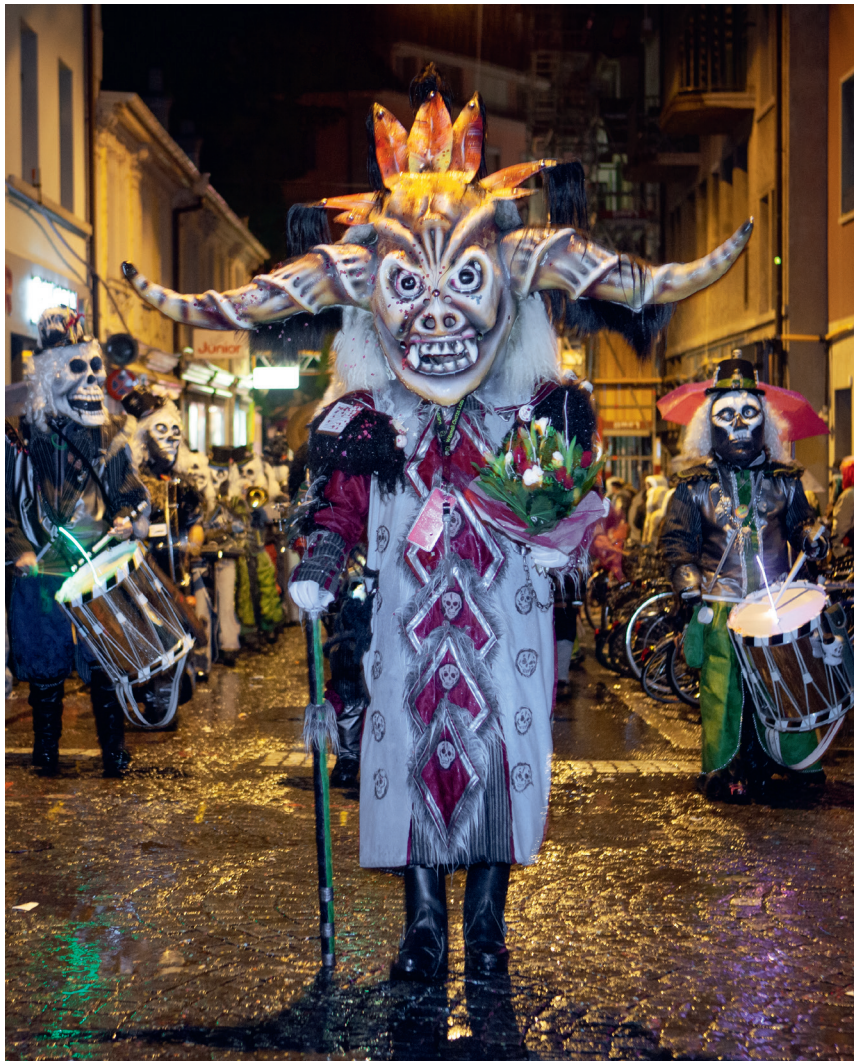
Monstercorso am Gütisdienstag.

koppelt sein. Die durch die «Vereinigten» gemeldeten Wagen werden am Gütisdienstag um 18.30 Uhr von der Feuerwehr beim Luzerner Theater kontrolliert. Siehe auch Hinweise auf www.vereinigte.ch .